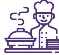
خدمات الأطعمة والاعاشة CATERING AND LIVING SERVICES