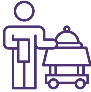
خدمات الضيافة الفاخرة LUXURY HOSPITALITY SERVICES

At Jara & ShoKa, we offer a full range of high-end hospitality services designed to meet the needs of our customers at various events and events. We believe that details make all the difference, which is why we are Keen to provide exceptional hospitality experiences that combine luxury and high quality. Our services include: