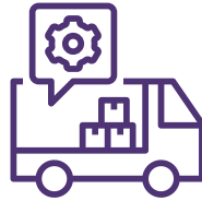
الخدمات اللوجستية LOGISTICS SERVICES