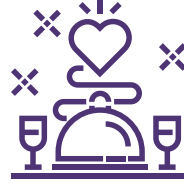
خدمات حفلات الزفاف والمناسبات WEDDING AND EVENT SERVICES