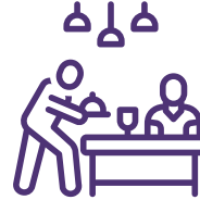
تشغيل المطاعم والمقاهي OPERATION OF RESTAURANTS & CAFES